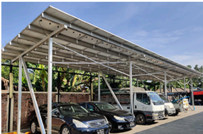
Figura 2- Esempio di installazione

L'installatore deve verificare la fattibilità di installare la pensilina attraverso l'apposizione di togliolini o strutture prefabbricate. E' possibile prevedere l'ancoraggio al muro perimetrale.